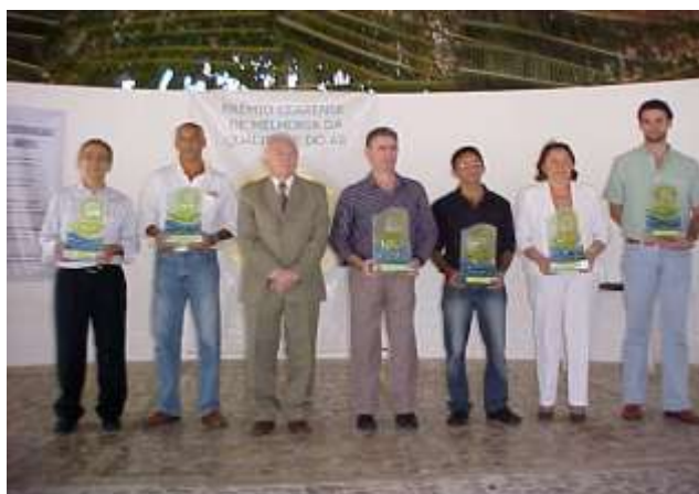
Representantes: Vitória, Via Urbana, CEPI MAR, Dragão do Mar, Cerama, Daniel Transportes e Via Máxima

No último dia 05 de junho, Dia Mundial do Meio-ambiente, a Dragão do Mar conquistou o Prêmio Cearense de Melhoria da Qualidade do Ar 2007 na categoria Transporte de Passageiros, oferecido pela Federação dos Transportes CEPI-MAR (Ceará, Piauí e Maranhão). A versão 2007 do Prêmio contou com a inscrição de 39 empresas. Foram contempladas, além da Dragão do Mar, as empresas Vitória, Via Urbana e Via Máxima, na categoria transporte de passageiros, Daniel Transportes e Cerama, na categoria transporte de cargas.