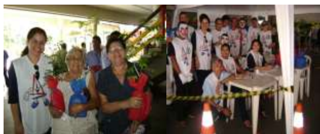
Ação Terminal Parangaba