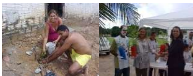
Moradores de Caucaia felizes com a doação